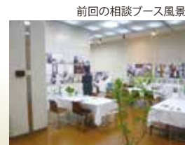
前回の相談ブース風景

今のお住まいのお困りのことや、気になっていることなど、簡単に改善できることもございます。どうぞお気軽に相談下さい。